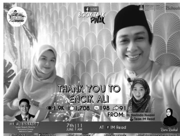
Gambar 1: Kerjasama antara IM Read dan Perpustakaan Negara Malaysia

Anjuran perkongsian video masakan di kalangan alumni, pelajar dan juga pensyarah Fakulti Pengurusan Maklumat turut meraih perhatian dan membantu komuniti ini untuk bersama berkongsi idea dan resepi masakan. Tujuan utamanya adalah untuk mengisi kelapangan masa dengan aktiviti yang berfaedah buat mereka yang berkongsi minat yang sama. Penyertaan beberapa pensyarah berkongsi video masakan dan resepi turut menarik dan menambah minat pengguna di musim PKP untuk mencuba pelbagai idea masakan dan seterusnya menyertai pertandingan video masakan yang diadakan. Pelbagai tips dan gaya kehidupan sihat dipaparkan untuk perkongsian. Selain itu perkongsian ulasan buku dalam talian turut