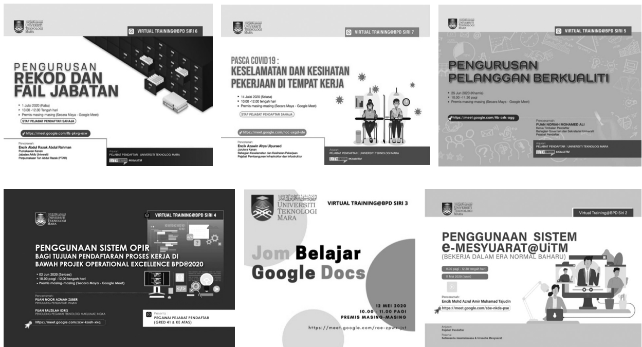
Rajah 1.3: Penganjuran Program Latihan Dalam (In House Training)