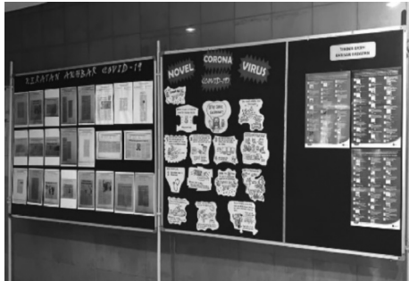
Pameran Perpustakaan Sepanjang PKP